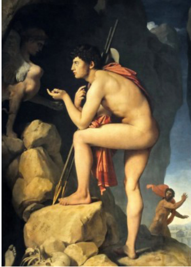
1. Ingres, Œdipe et le Sphinx