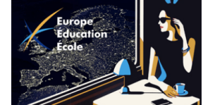
Jean-Luc GAFFARD, Réalisation et production Czeslaw MICHALEWSKI Animation et communication

En podcast : https://soundcloud.com/podcastprojeteee