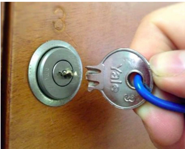
4. Clé cassée