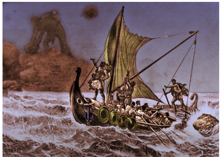
5. Ulysse et Polyphème